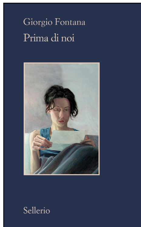
I tre finalisti del Premio Salgari: “Prima di noi”, “Io sono la strega” e “La grande caccia”

Giovedì 1 ottobre alle 11 alla Sala Rossa della Provincia di Verona avverrà la presentazione alle Autorità, alla Stampa e al pubblico dei VINCITORI finalisti della VIII Edizione del Premio “Emilio Salgari” di Letteratura Avventurosa, organizzata e promossa dall’Associazione “Il corsarone” di Verona, dal Comune di Negrar di Valpolicella (VR) e dall’Università del Tempo Libero di Negrar (UTL) in collaborazione con l’Assessorato alla Cultura del Comune di Negrar di Valpolicella, la casa editrice il Rio di Mantova (MN) e la casa editrice Oligo Editori di Mantova (MN), la libreria Pagina12 di Verona (VR) e altri enti pubblici e privati, con il patrocinio della Regione Veneto, della Provincia di Verona e del Comune di Negrar di Valpolicella e con il sostegno di varie associazioni culturali nazionali.